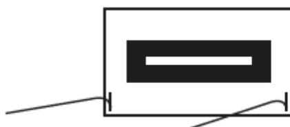
Riiv on lahti/ Põleti avatud