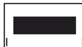
Riiv on kinni/ Põleti suletud